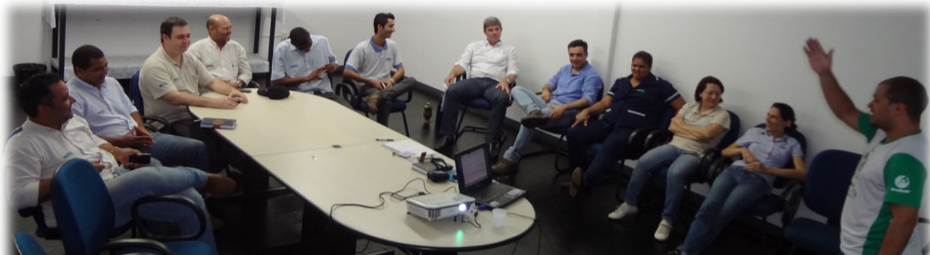
Foto nº 03 – Trabalhos internos com a equipe AMPASUL, sobre várias temáticas importantes, inclusive nas propriedades.