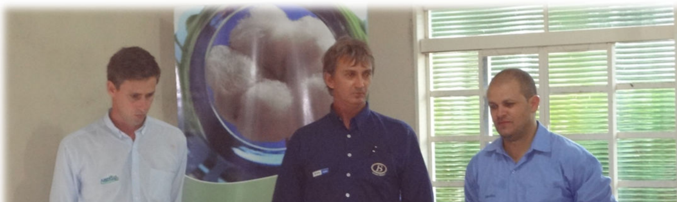
Foto nº 02 – Gerente da Propriedade e funcionários AMPASUL explanando sobre a importância dos funcionários trabalharem preventivamente.