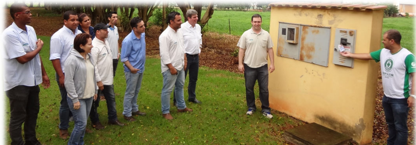
Foto nº 04 – Trabalhos internos com a equipe AMPASUL, bloqueio de segurança em quadros energizados.