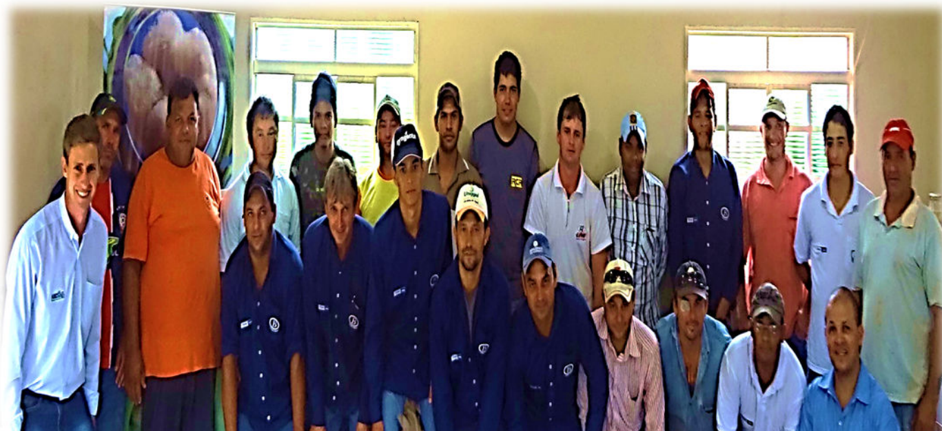
Foto nº 01 – Integração com funcionários de uma propriedade sobre: Saúde e Segurança do Funcionário, Técnicas de Prevenção e uso correto de EPI's, Deveres e Direitos, NR 6, Relação interpessoal e Atos e Condições inseguras.